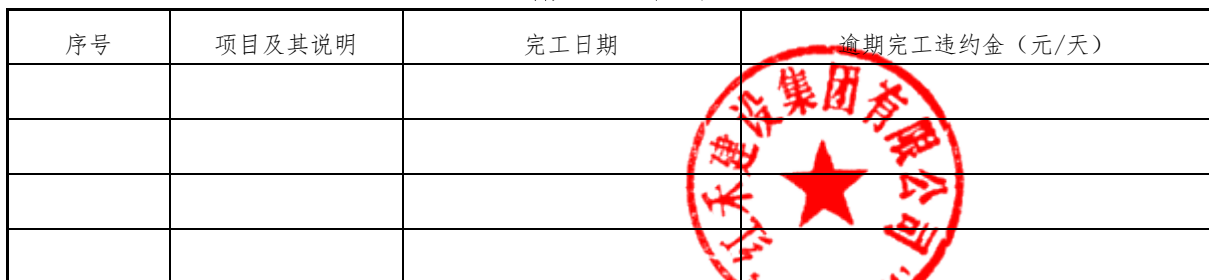
逾期完工违约金表

(2) 全部逾期完工违约金的总限额为 每延误工期一天支付违约金人民币 2000 元（不超过合