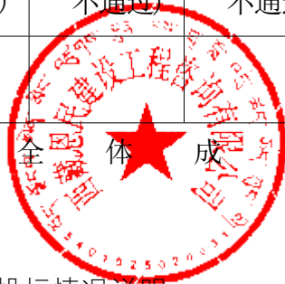
附表 A-20：评标委员会复核否决投标情况说明