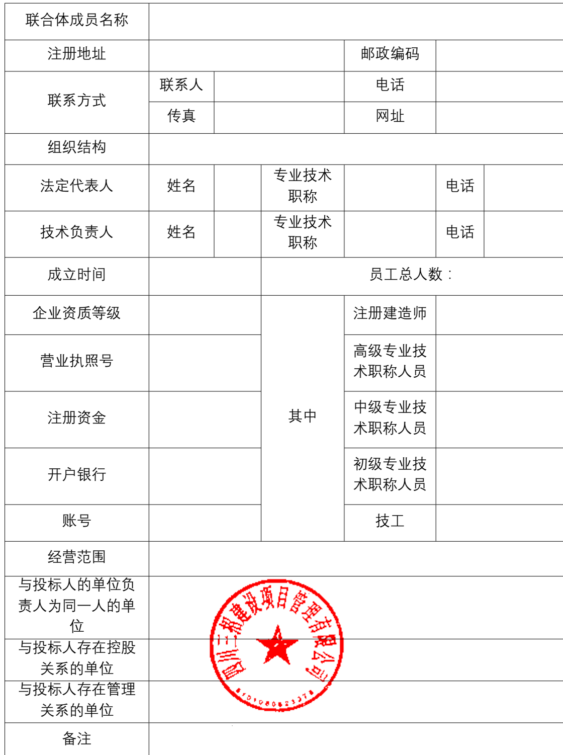
基本情况表（成员单位）

注：投标人应根据投标人须知第 3.5.1 项的要求在本表后附相关证明材料扫描件。