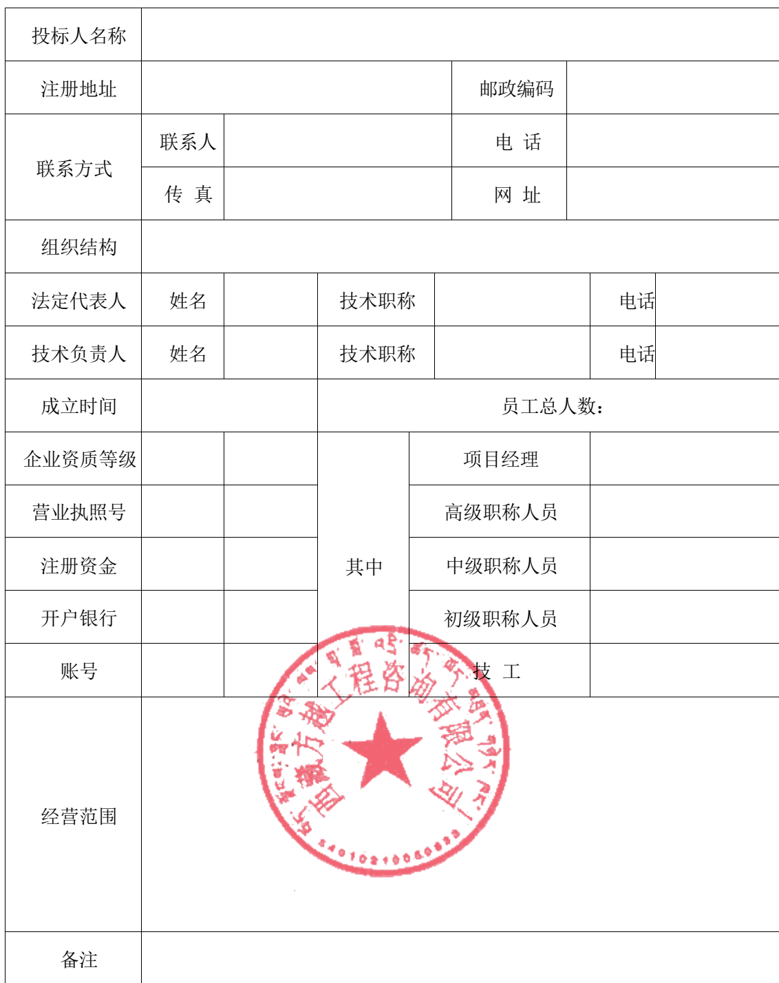
(一) 投标人基本情况表

备注：本表后应附企业法人营业执照及其年检合格的证明材料、企业资质证书副本、安全生产许可证等材料的复印件。