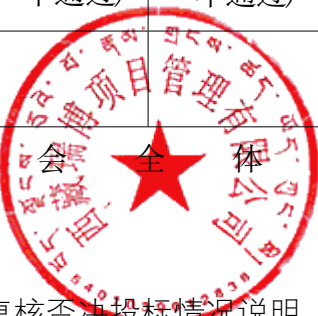
附表 A-20：评标委员会复核否决投标情况说明