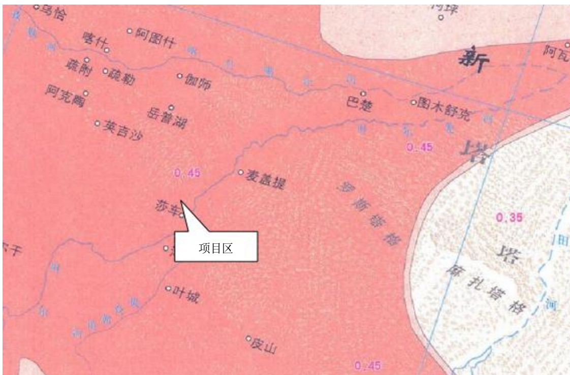
图2-3 项目区地震动峰值加速度图