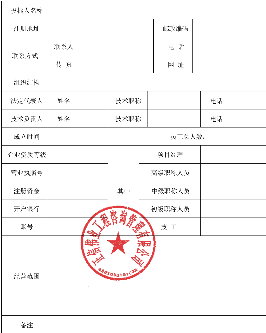
(一) 投标人基本情况表

备注：本表后应附企业法人营业执照及其年检合格的证明材料、企业资质证书副本、安全生产许可证等材料的复印件。