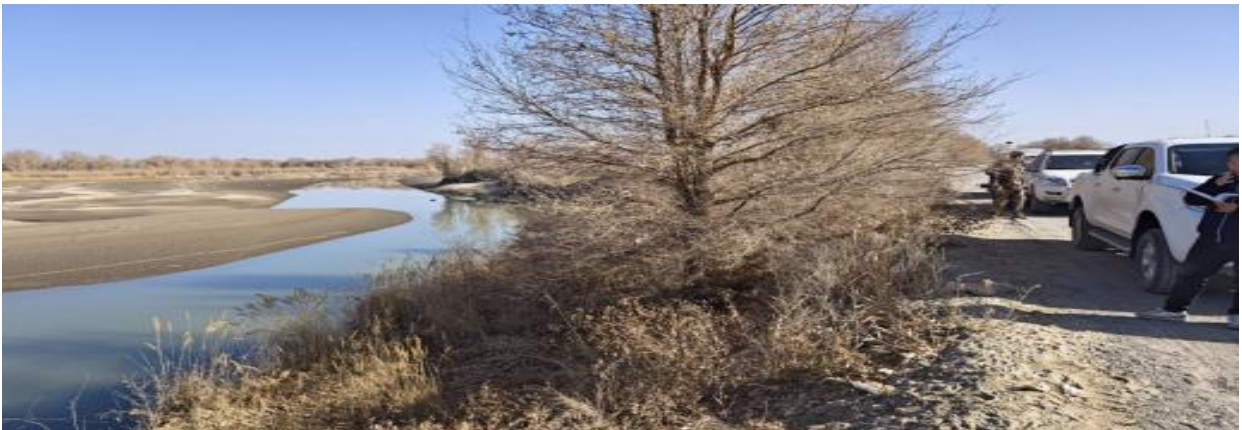
图 4.2-5 南岸 137+900 处护岸现状上游

根据现场踏勘情况，南岸137+900处由于弯道水流作用，现状护岸弯道处上下游约250m范围内岸坡淘刷、垮塌严重，河岸线后退5~10m，河岸线已经紧邻南岸输水堤，严重威胁到输水堤安全，亟需改造加固。现状护岸沿线存在一些零星胡杨，护岸维修时注意保护现状植被。