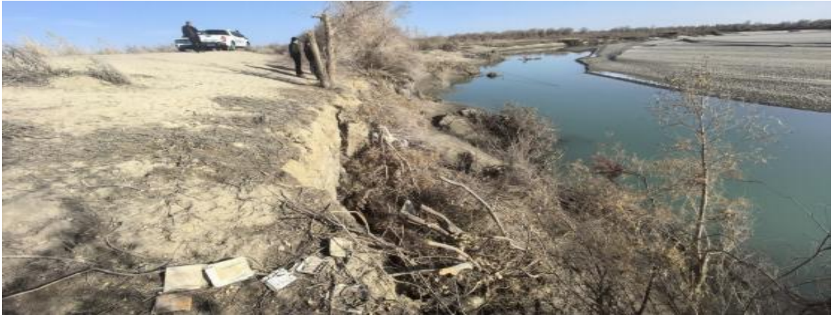
图 4.2-9 北岸 113+900 处护岸现状上游