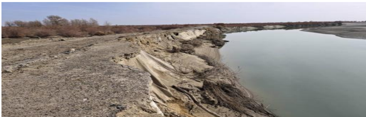
图 4.2-7 北岸 77+000 处护岸现状上游

根据现场踏勘情况，北岸77+000处由于弯道水流作用，现状护岸弯道处上下游约300m范围内岸坡淘刷、垮塌严重，河岸线后退10~15m，河岸线已经紧邻北岸输水堤，严重威胁到输水堤安全，亟需改造加固。现状护岸主要为土坡，存在零星无纺布，本次改造时清除无纺布等杂物后，再进行护岸维修。