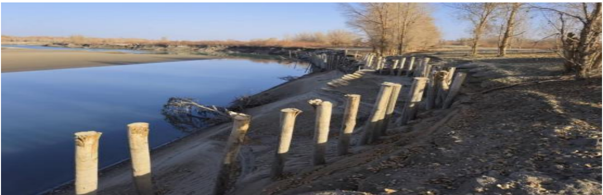
图 4.2-3 南岸 72+000 处护岸现状上游

根据现场踏勘情况，南岸72+000处由于弯道水流作用，现状护岸弯道处上下游约220m范围内岸坡淘刷、垮塌严重，河岸线后退10~15m，河岸线已经紧邻南岸输水堤，严重威胁到输水堤安全，亟需改造加固。现状护岸弯道处已建阻滑木桩与土堤结合较为紧密，本次工程进行合理利用，保留现状阻滑木桩。