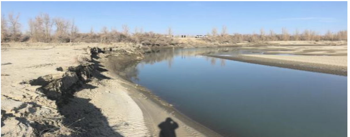
图 4.2-10 北岸 113+900 处护岸现状下游