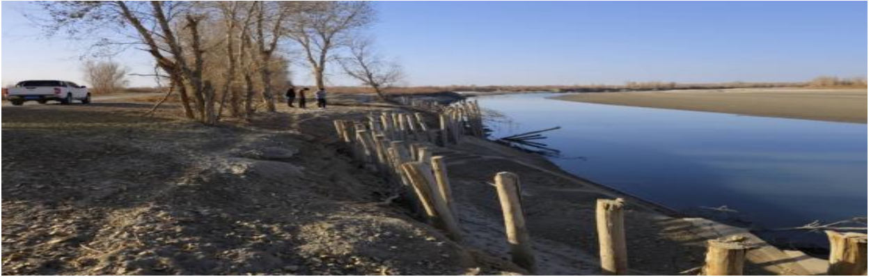
图 4.2-4 南岸 72+000 处护岸现状下游