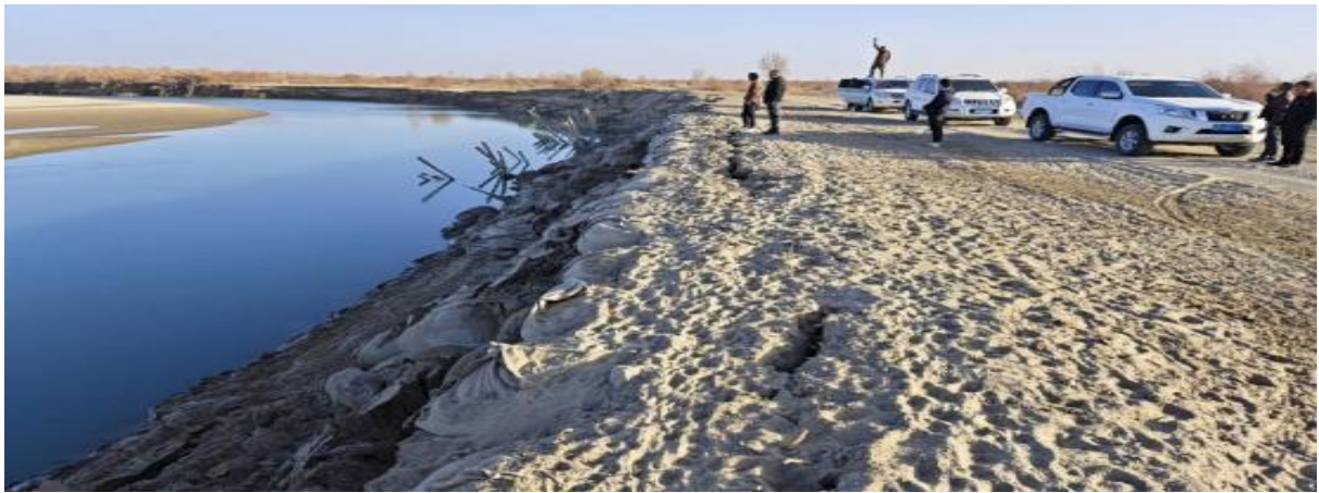
图 4.2-1 南岸 64+500 处护岸现状上游