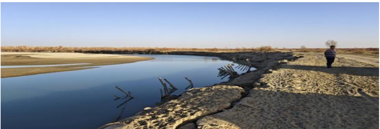
图 4.2-2 南岸 64+500 处护岸现状下游