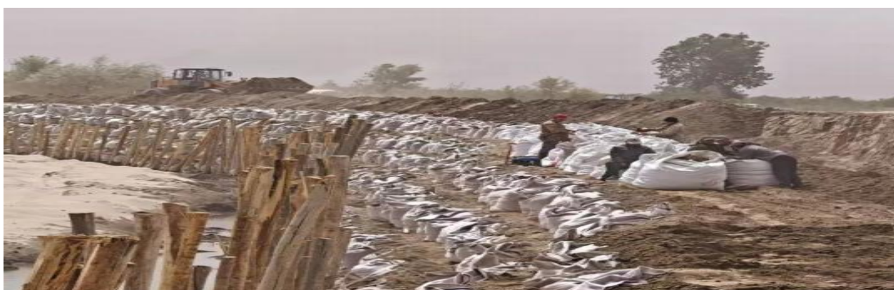
图 4.2-11 土工袋护岸施工现场

土工布防洪袋是一种新型材料，具有高强度、耐腐蚀、抗老化等特点，能迅速填充并固定在险工险段周围，形成一道坚实的防线。