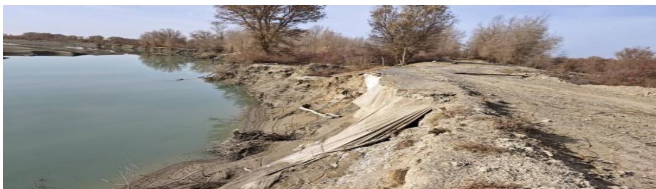
图4.2-8北岸77+000处护岸现状下游